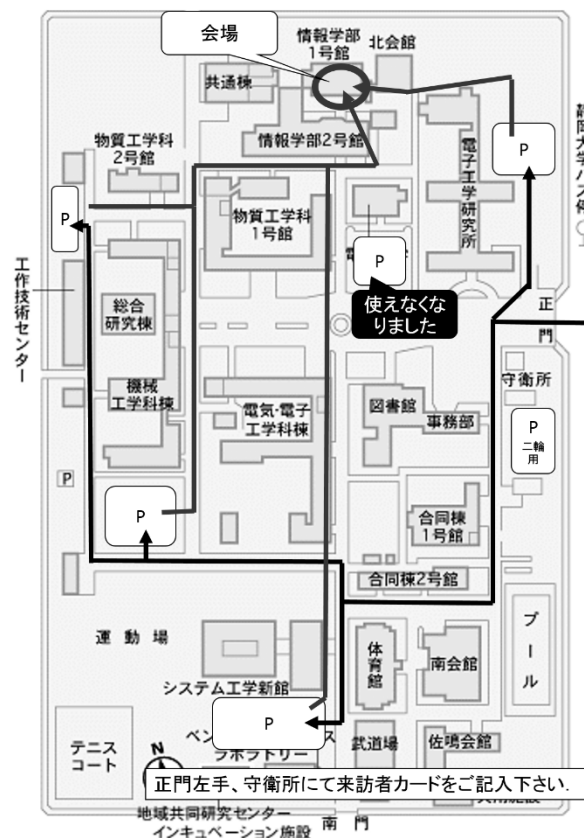
静岡大学浜松キャンパス内、情報科学第1実験室（会場）までのアクセス